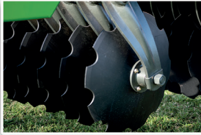
Discos independientes con mazas de alta velocidad y bajo mantenimiento