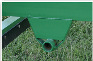
Sistema de transporte en calle