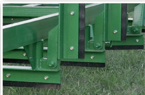
OPCIONAL: Cuchillas Cambiables de Acero SAE 1040