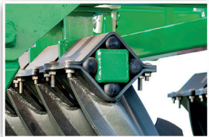
Elastómeros para absorción de impactos