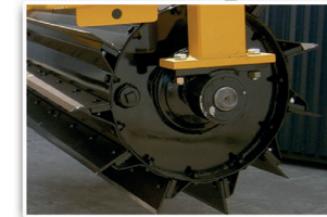
11 Cuchillas por rolo